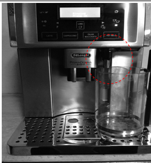
( 圖四 )

若使用全自動咖啡機專用除鈣劑 · 請先 加溫水 1500cc · 再加入全自動咖啡機專 用除鈣劑 150 克 · 攪拌溶解均勻 · 即可 倒入水箱中