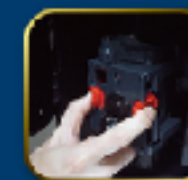
易拆洗小型沖泡器