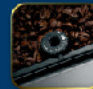
咖啡研磨粗細調整鈕