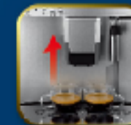
可調式咖啡出水口